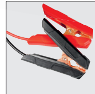
Indító (bika) kábel