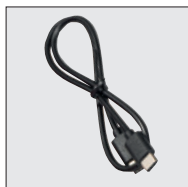
Kétoldalú C-típusú kábel