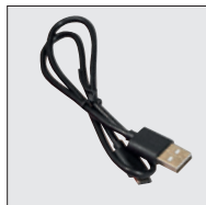
USB és C-típusú kábel