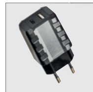
Hálózati töltő (5V/3A)